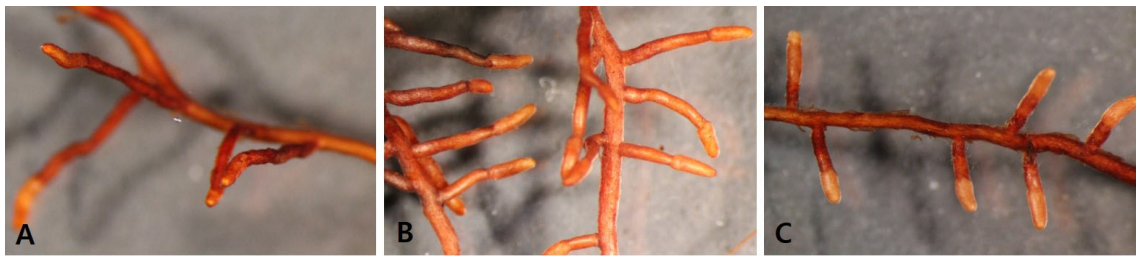
Fig. 3. Shape of roots by mycorrhizal fungus treatment: Top fresh weight (A), Control (HY8199, 2X) (B), OI: Oidiiodendron maius (HY8213, 1.6X) (C), PT: Pisolithus tinctorius (HY8219, 2X).

*PT: Pisolithus tinctorius , OI: Oidiiodendron maius ; The analysis indicated that all measured variables showed significant changes over time ( p < 0.05 ) and significant interactions between time and treatment groups ( p < 0.05 ), with corrections for sphericity violations applied as necessary, ensuring the findings' statistical significance.